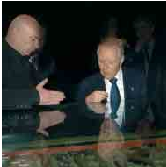
Pasquale Pistorio VicePresidente Confindustria per l'Innovazione e la Ricerca

La crescita e lo sviluppo si basano sulla diffusione della cultura dell'Innovazione a 360° e della collaborazione tra il sistema della ricerca e quello delle imprese. Nella creazione dei network della conoscenza, i Parchi Scientifici e Tecnologici svolgono un ruolo strategico operando come partner delle imprese, prima ancora che come fornitori di soluzioni tecnologiche. Questa è la strategia di Kilometro Rosso, che punta sulla multisetorialità e l'integrazione dei saperi per valorizzare al meglio i risultati della Ricerca e Sviluppo, orientandone le applicazioni verso l'innovazione radicale e di prodotto così da attrarre nuove iniziative high tech. Espressione della volontà delle imprese, Kilometro Rosso sarà a fianco del territorio per farlo crescere attraverso l'innovazione.